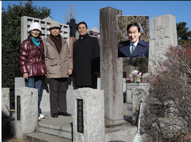
横の碑 大日本禁酒爺