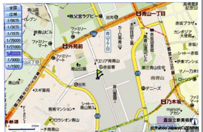
半蔵門線外苑前下車 ITOCHUビルを見て右折し 450m で管理事務所